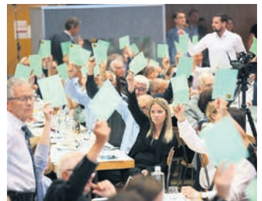
Die Delegierten der FDP sprachen sich klar und deutlich gegen die SBI aus.

Gegen Ende der Versammlung beschliessen die Delegierten die Parolen für die nächsten Abstimmungsvorlagen vom 25. November 2018. Sie sprachen sich mit überwältigender Mehrheit gegen die populistische Selbstbestimmungs-Initiative aus. Zudem unterstützten sie klar die Änderung des Bundesgesetzes über den Allgemeinen Teil des Sozialversicherungsrechts (ATSG). Die Änderung ermöglicht eine schärfere Bekämpfung von Versicherungsbetrug.