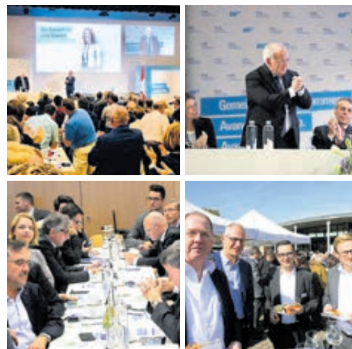
Die FDP-DV in Pratteln stand im Zeichen der Verabschiedung der liberalen Vision sowie des Rücktrittes von Bundesrat Johann Schneider-Ammann. Sie war aber für die Basler Delegation auch ein Besuch bei Freunden.