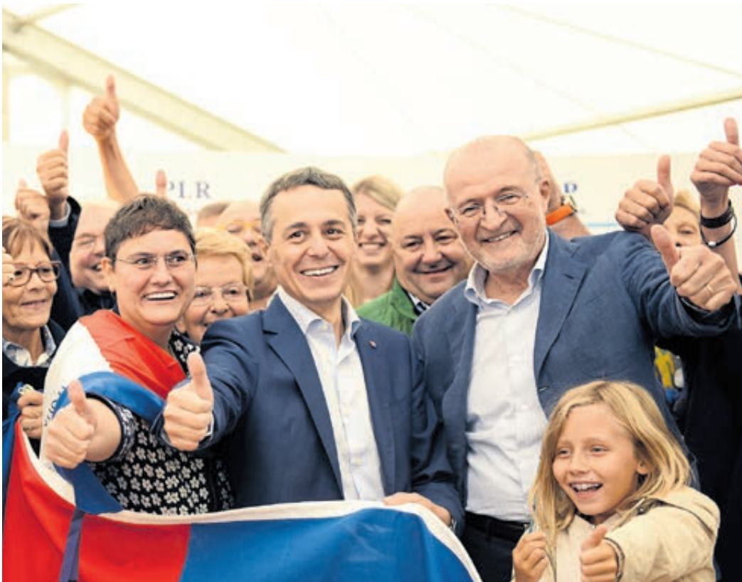
«Liberale Werte sind aktuell wie eh und je»: Fulvio Pelli (rechts) mit Bundesrat Ignazio Cassis (Mitte).