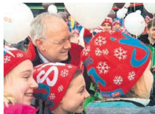
Beste Bildungsmöglichkeiten für die zukünftigen Generationen liegen Johann Schneider-Ammann besonders am Herzen.

• Fürsprecher für die gelebte Sozialpartnerschaft: Verfechter des Dialogs zwischen Arbeitge-